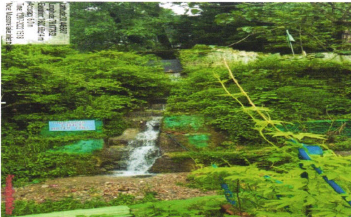
Fig. 6 :Inlet of Mussoorie Lake