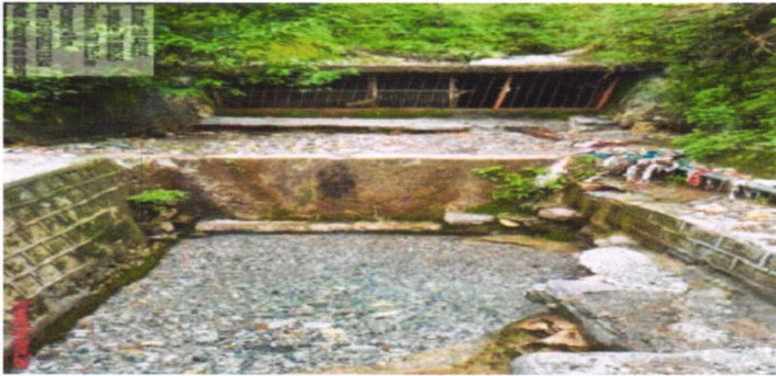
Fig. 3: Tapped by Jal Sansthan and Seepage goes downstream