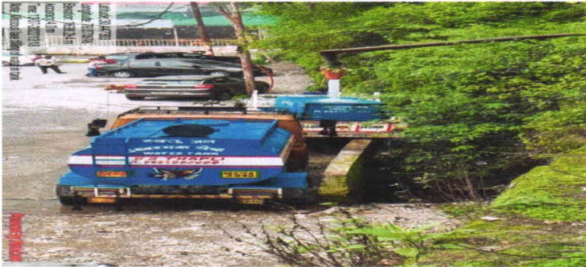
Fig. 5: Tapped water for tanker feeding for hotel & other commercial establishment