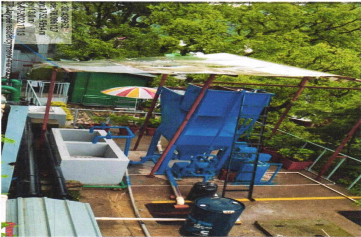
Fig. 12: ETP in Jaypee Residency Manor