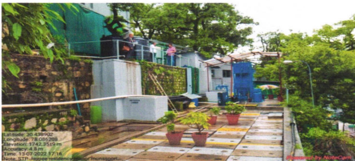
Fig. 11: STP in Jaypee Residency Manor