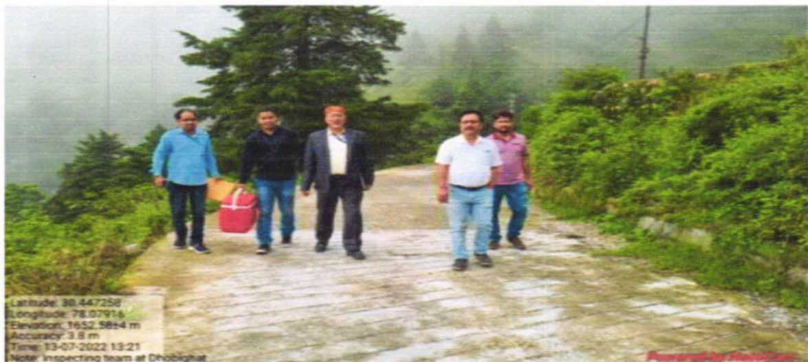
Fig.1:Team member the Joint Inspection committee