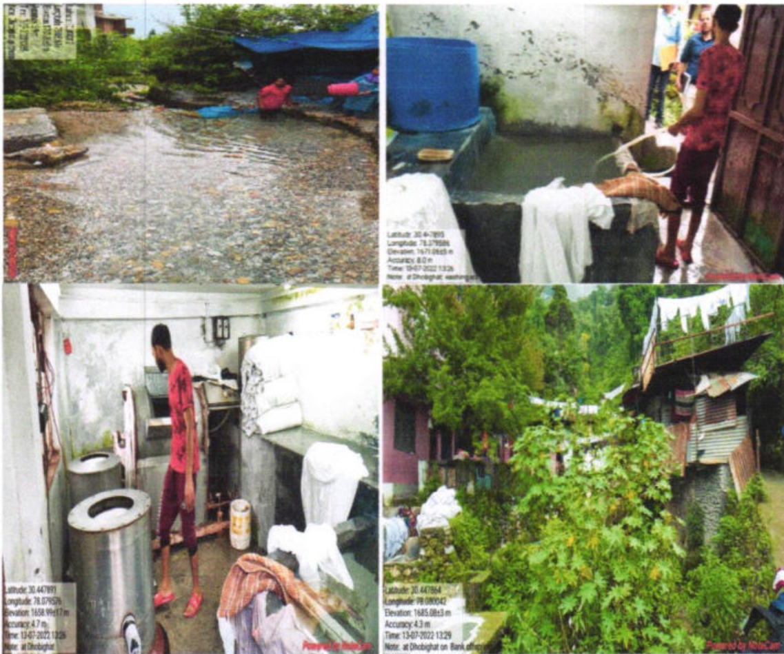
Fig. 4: Passes through Dhobi Ghat & Washerman uses water for washing clothes for commercial purpose