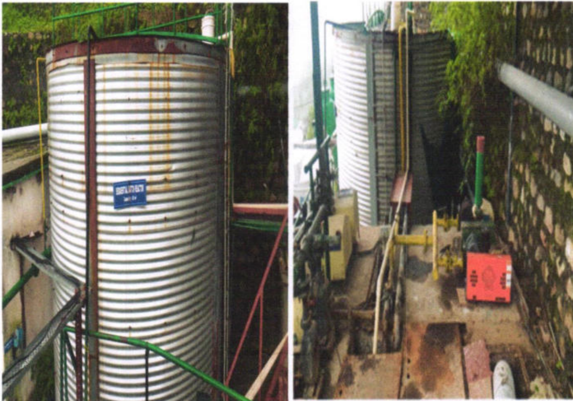
Fig no.9 : STP of Savoy Hotel