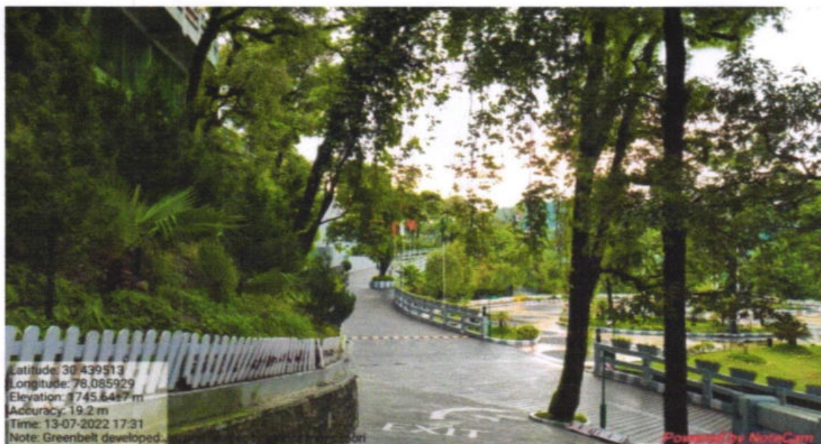
Fig. 10: Green Belt developed by Jaypee Residency Manor