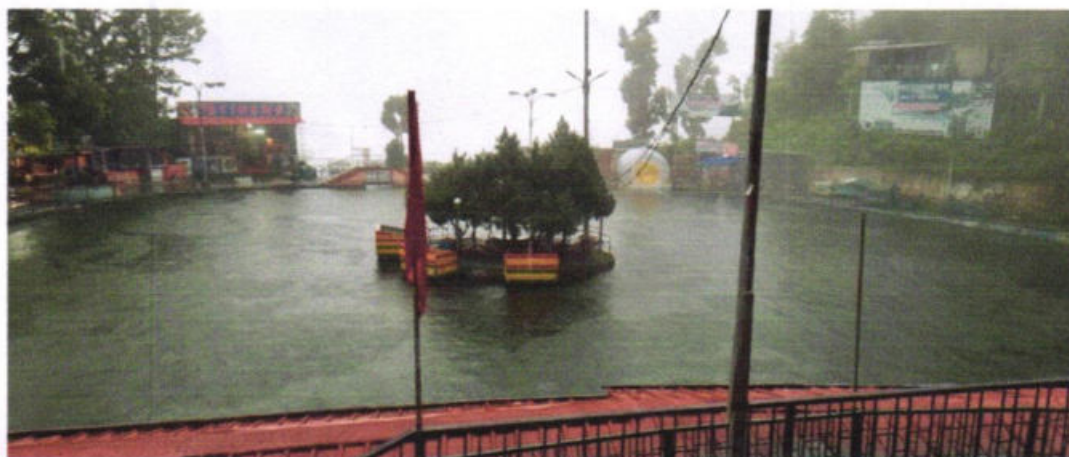
Fig. 3: Bird Eye View of Mussoorie Lake

In Dhobi Ghat approximately 50-60 families are habituating on the either bank of the water spring in this hilly area. All of them are engaged in the washing of clothes for commercial purpose. During discussion with the people around that they get clothes mostly from the hotels/ hospitals. They are not well organized and the wastewater generated from washing activities being directly discharged into the continuous flowing water spring which further goes to different hotel industries, commercial establishment and Mussoorie Lake. In the upstream of Dhobi Ghat water has been tapped by the Jal Sansthan, which they are using for the supplying in the urban areas, which includes hotels and other commercial activities. The seepage form this point goes downstream and used by the washerman, tapping by the tankers and rest water goes to Mussoorie Lake and Bhatta fall. Detailed flow diagram of water feeding system in Mussoorie lake is given as under with relevant photographs.