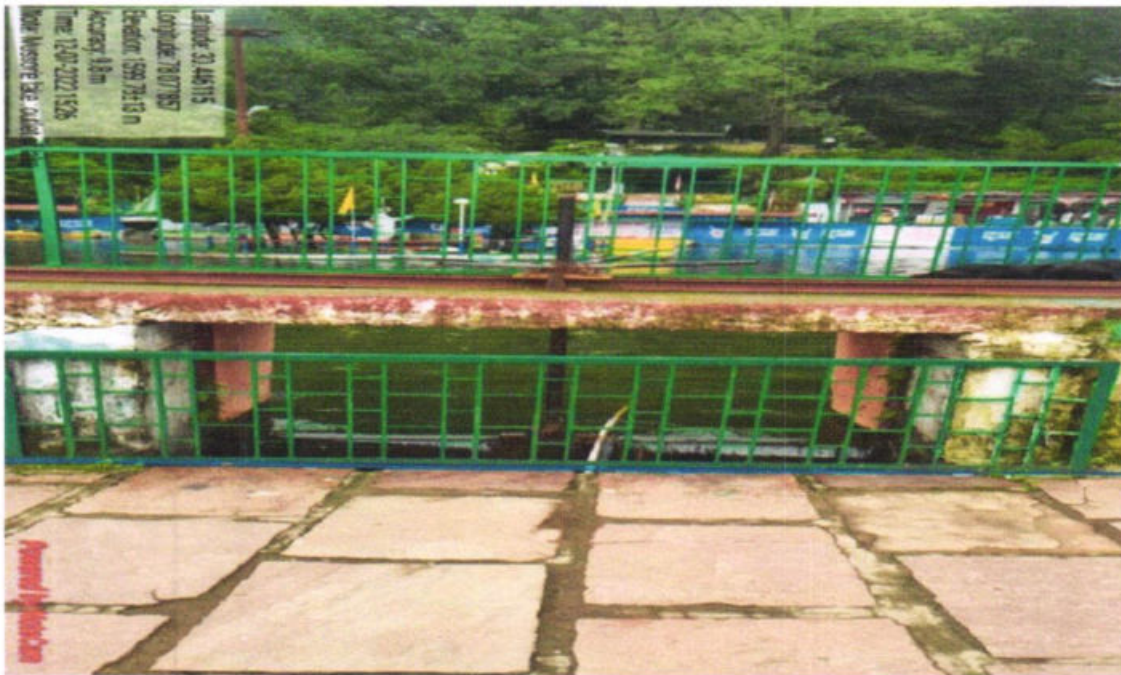
Fig. 7: Excess water Bypass & goes to Bhatta Fall (Outlet of Mussoorie Lake)

2. 11. No water extraction point in the Mussoorie Lake has been seen by the Joint Committee, which could be the potential use for the commercial establishment such as by hotels etc. 11