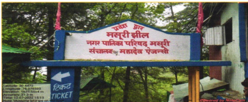
Fig. 2: Main Gate of Mussoorie Lake